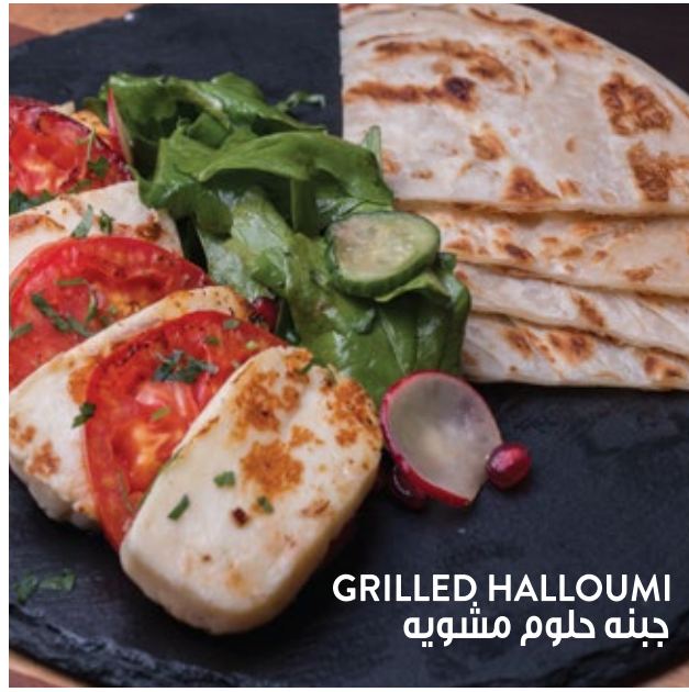
GRILLED HALLOUMI جبنه حلوم مشويه