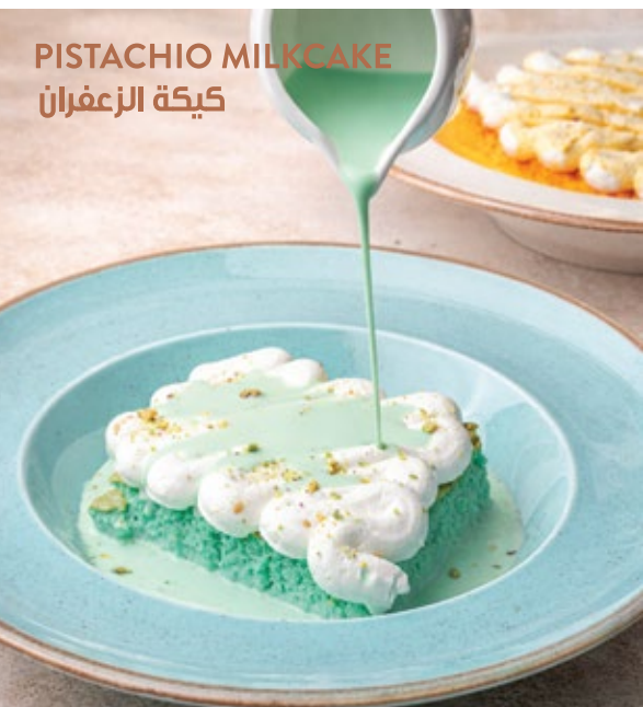
PISTACHIO MILKCAKE كيكة الزعفران