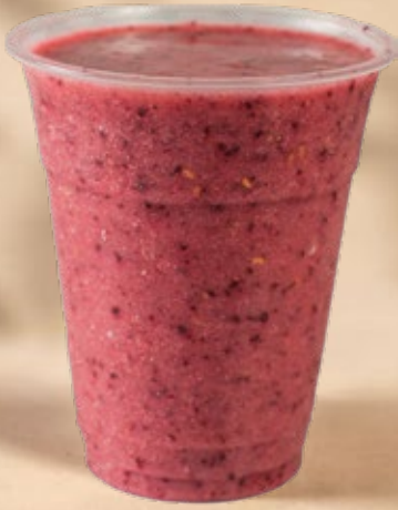
BERRY LOVE بيري لوف