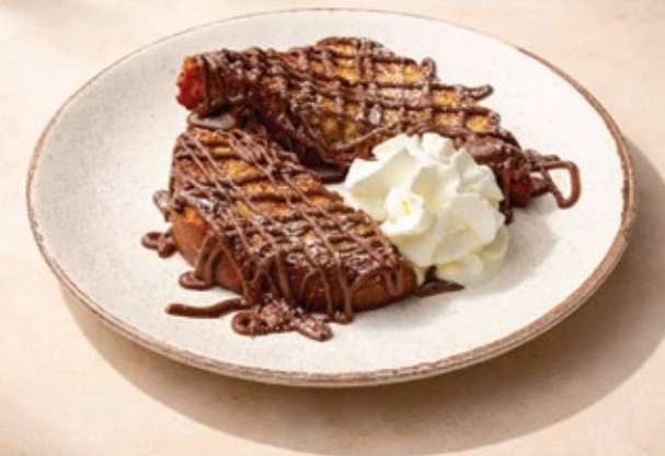
FRENCH TOAST توست فرنسيه