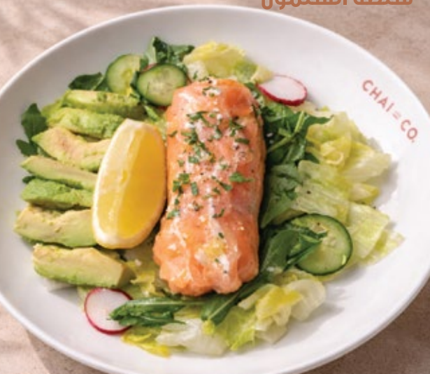
SALMON AVOCADO SALAD سلطة السلمون