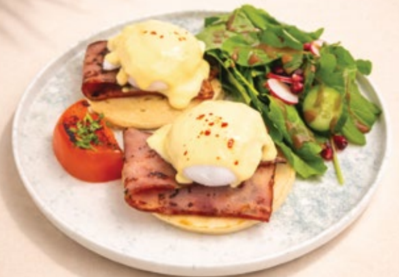
PANCAKES BENEDICT بان كيك بندیکت