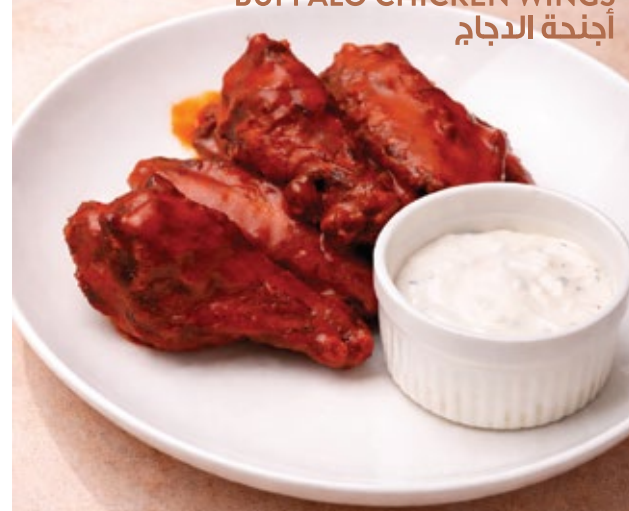
BUFFALO CHICKEN WINGS أجنحة الدجاج