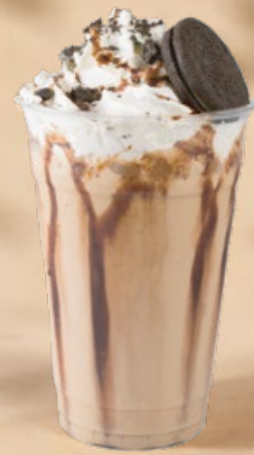
OREO MILKSHAKE فروك