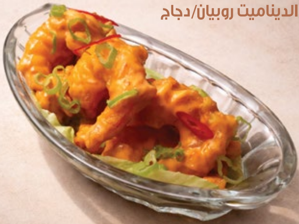
DYNAMITE PRAWNS/CHICKEN الديناميت روبيان/دجاج