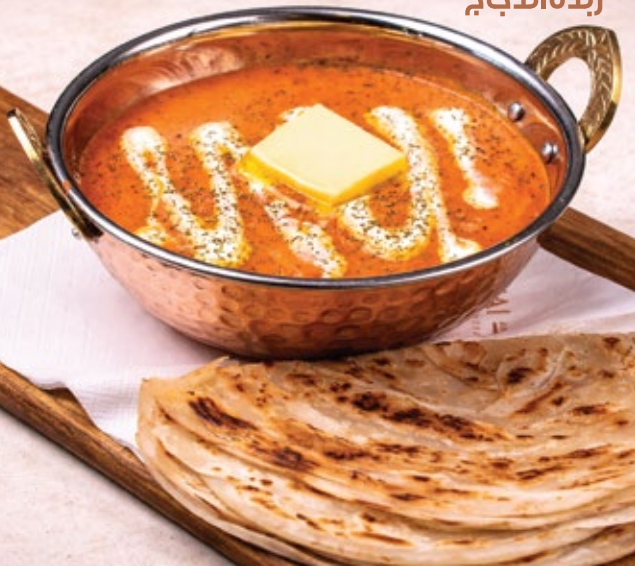
BUTTER CHICKEN / PANEER زبدة الدجاج