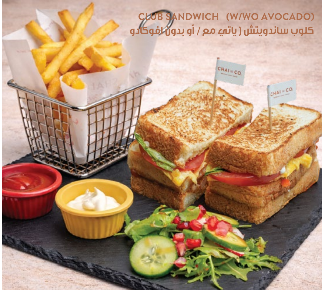
CLUB SANDWICH (W/WO AVOCADO) كلوب ساندویش ( یاتیہ مع / او بدون افوگادو )