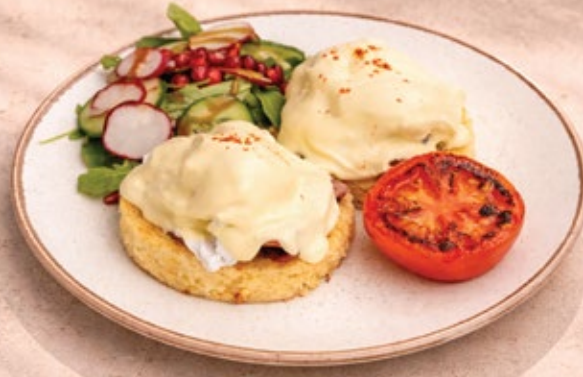
EGGS BENEDICT بندیکت البيض