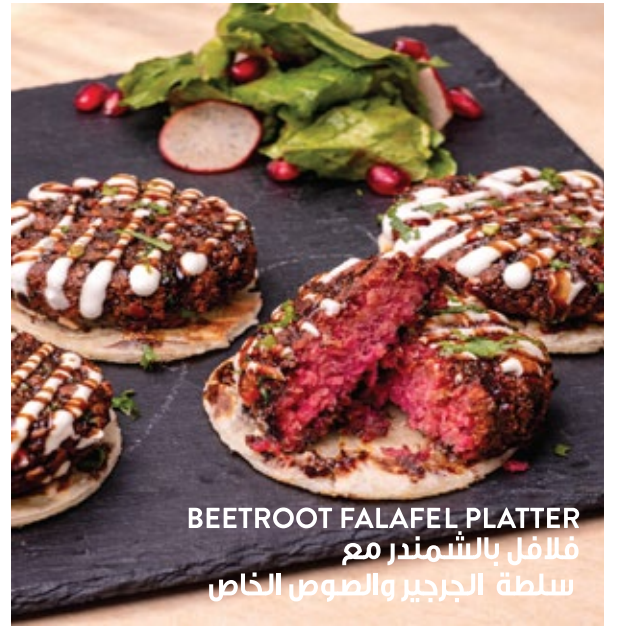
BETROOT FALAFEL PLATTER فلافل بالشمندر مع سلطة الجرجير والصوص الخاص