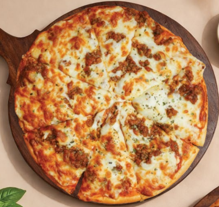
MEAT & CHEESE بيتزا كرسبي لحم وجبنة