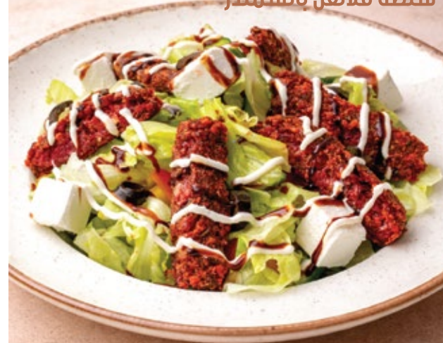
BEETROOT FALAFEL SALAD سلطة فلفل بالشمندر