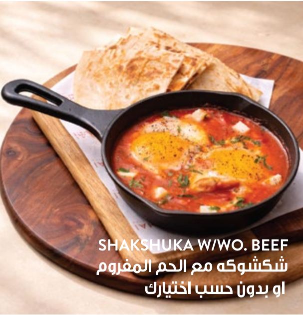
SHAKSHUKA W/WO. BEEF شكشوكه مع اللحم المفروم او بدون حسب اختيارك