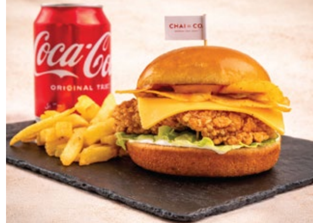
OMAN CHIPS WITH ZING CHICKEN COMBO فيليه دجاج زنجر مقلية