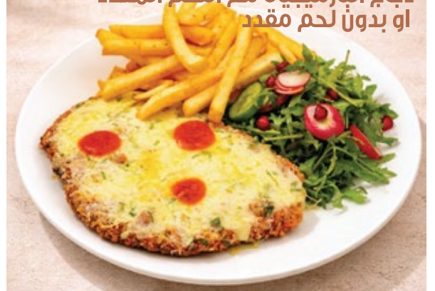
CHICKEN PARMIGIANA دجاج البارميچيانا مع اللحم المقدد او بدون لحم مقدد