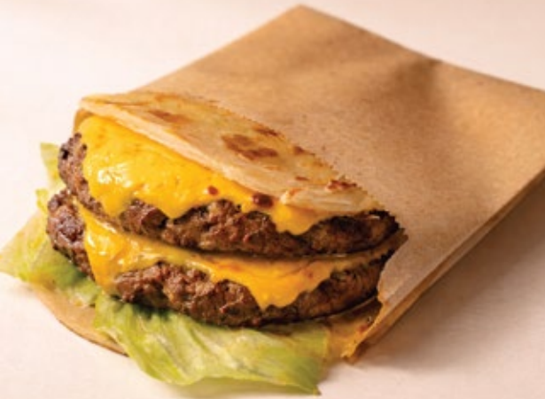
DOUBLE WAGYU PARATHA BUN زينج دجاج براتا بن