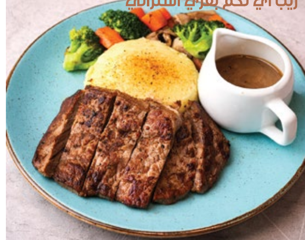
AUSTRALIAN RIBEYE STEAK ريب آي لحم بقرية أسترالي