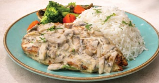
GRILLED CHICKEN BREAST صدر الدجاج المشوي