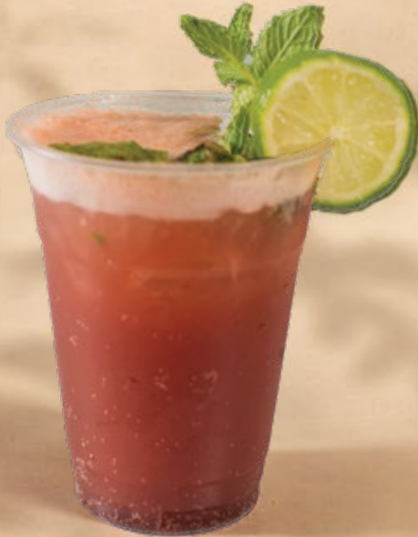
STRAWBERRY MOJITO موجيتو فراولة