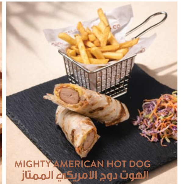
MIGHTY AMERICAN HOT DOG الهوت دوج الامريكاي الممتاز