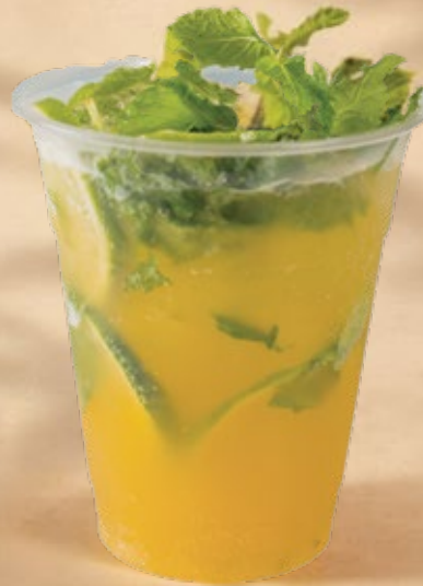
SUNRISE MOJITO موهيتو صن رايز