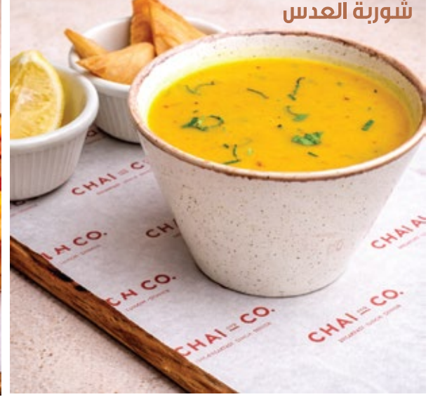
LENTIL SOUP شوربة العدس