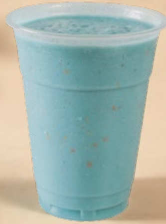
SUMMER BLUE الصيف الأزرق