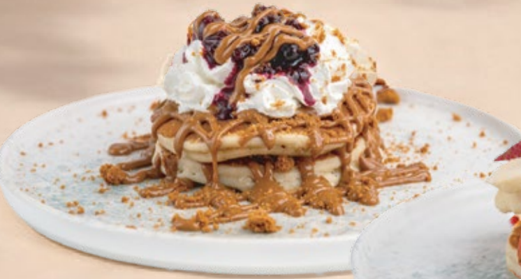
LOTUS AND BERRIES PANCAKES بان كيك نوتيللا والموز