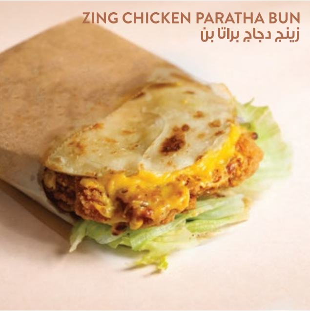
ZING CHICKEN PARATHA BUN زینگ دجاج براتا بن