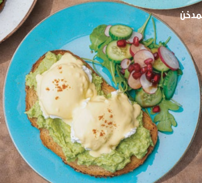
POACHED EGGS AND HOLLANDAISE SAUCE توست الأفوكادو مع البيض المسلوق وصلصة هولندا