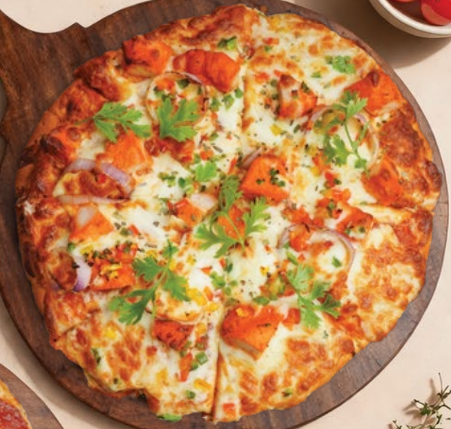
CHICKEN TIKA بيتزا كر سبي دجاج تيكا