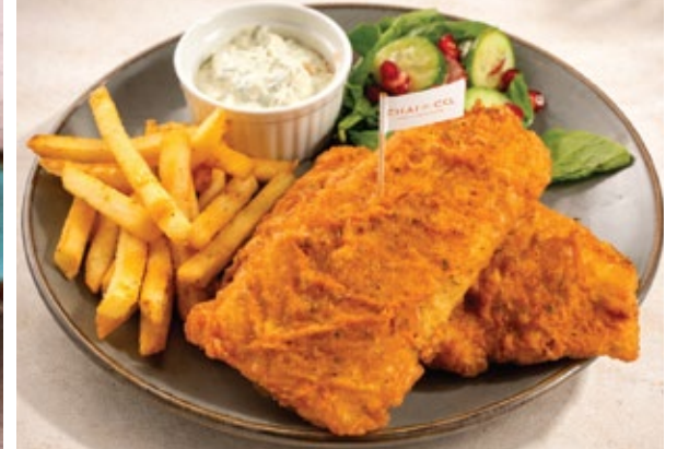
FISH & CHIPS سمك وشيبس