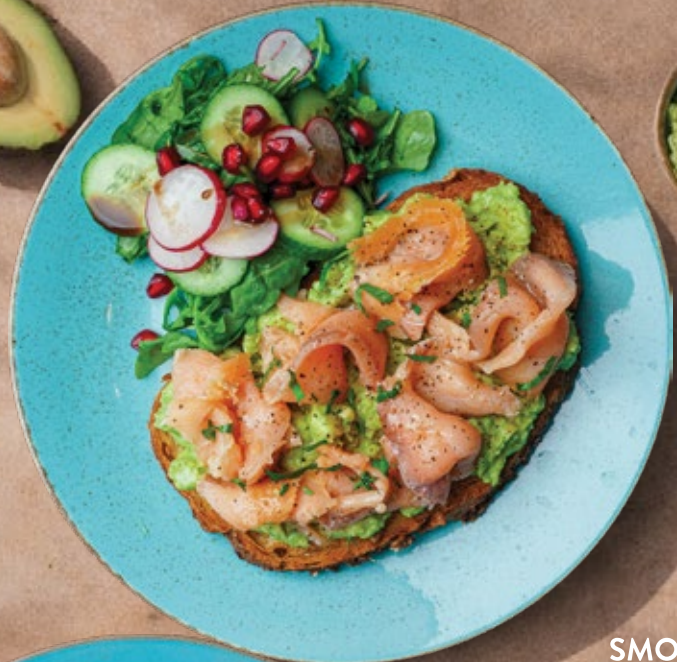
SMOKED SALMON توست الأفوكادو مع السلمون المدخن