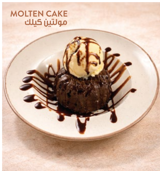
MOLTEN CAKE مولتين كيك