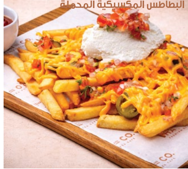
MEXICAN LOADED FRIES البطاطس المكسيكية المحملة