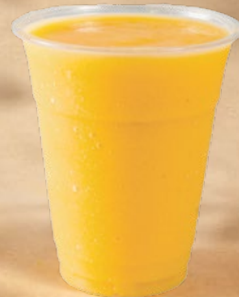
MANGO PARADISE مانجو لاسيب