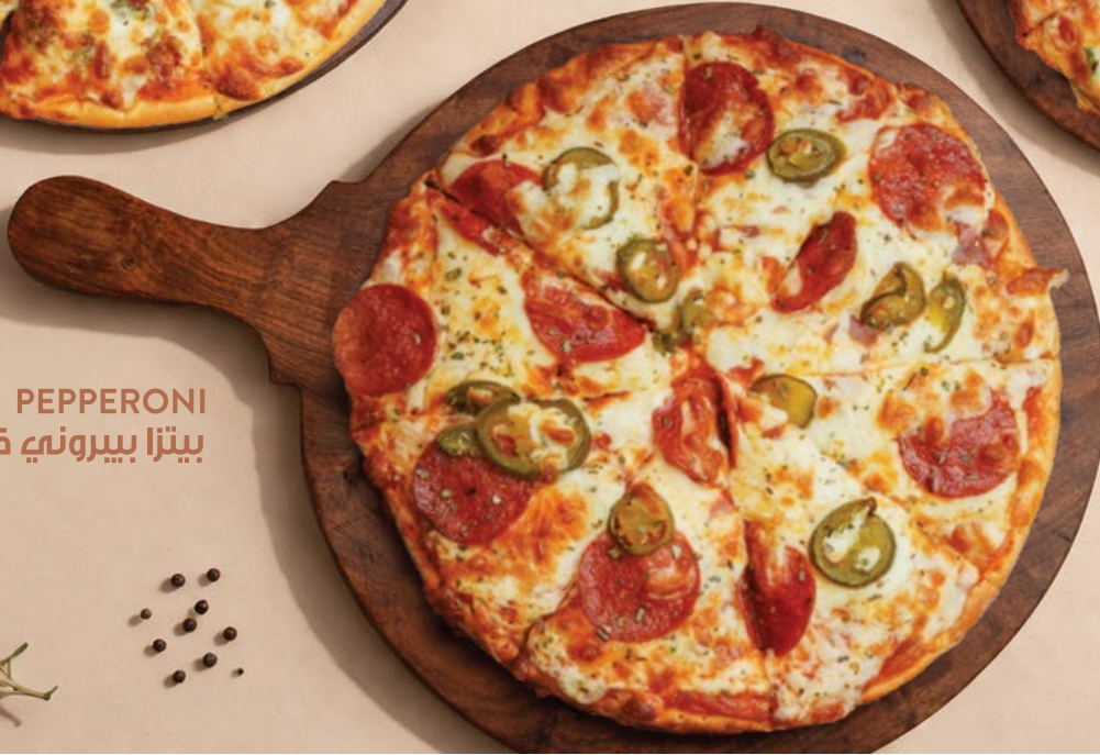
PEPPERONI بيتزا بيروني كرسبي