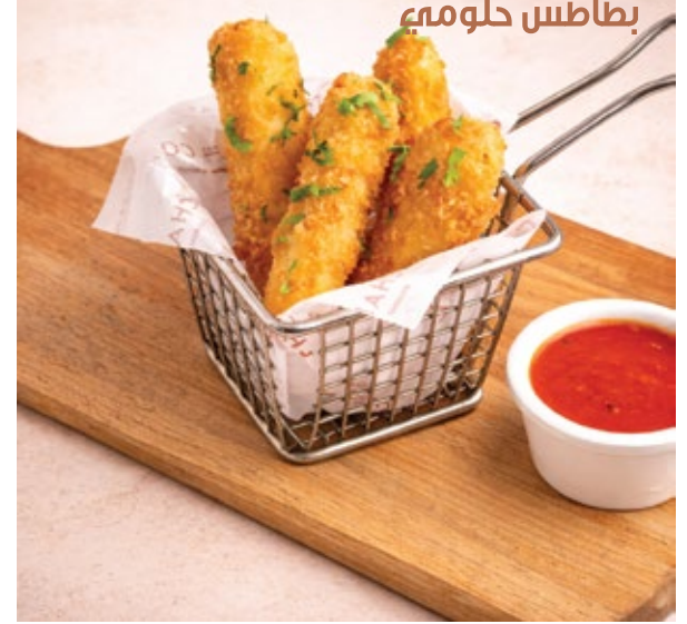
HALLOUMI FRIES بطاطس حلومي