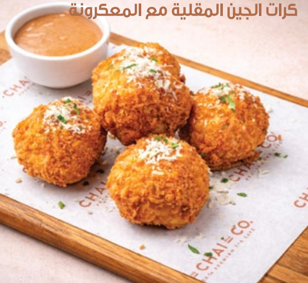
MAC AND CHEESE BALLS كرات الجبن المقلية مع المعكرونة