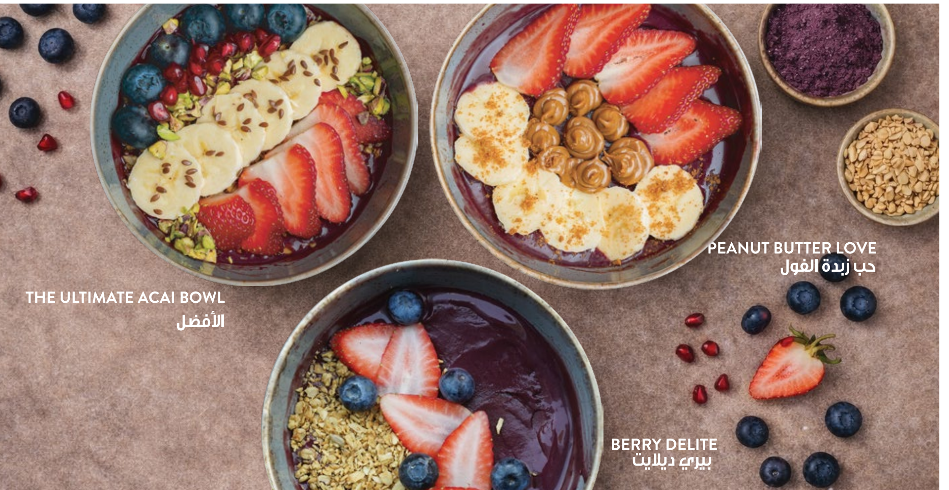
THE ULTIMATE ACAI BOWL الأفضل