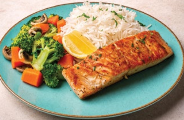
GRILLED SALMON شريحة سمك السلمون