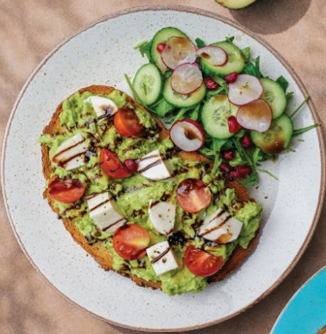
MOZZARELLA AND CHERRY TOMATO توست الأفوكادو مع الموزاريلا والطماطم الكرز