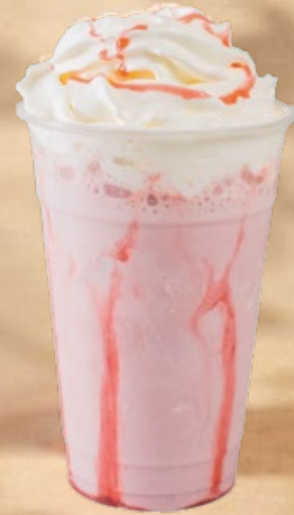
WHITE CHOCOLATE STRAWBERRY MILKSHAKE ميلك شيك شوكولاتة بيضاء بالفراولة