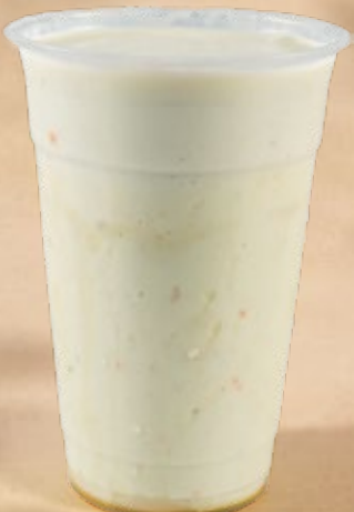
AVOCADO MILKSHAKE أفوكادو