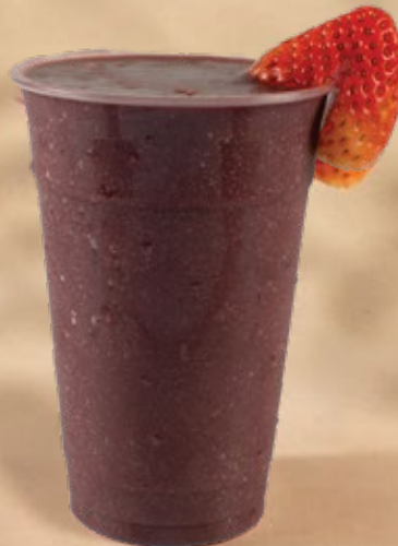
HAPPY ACAI SMOOTHIE سموثي اكايب سعيد