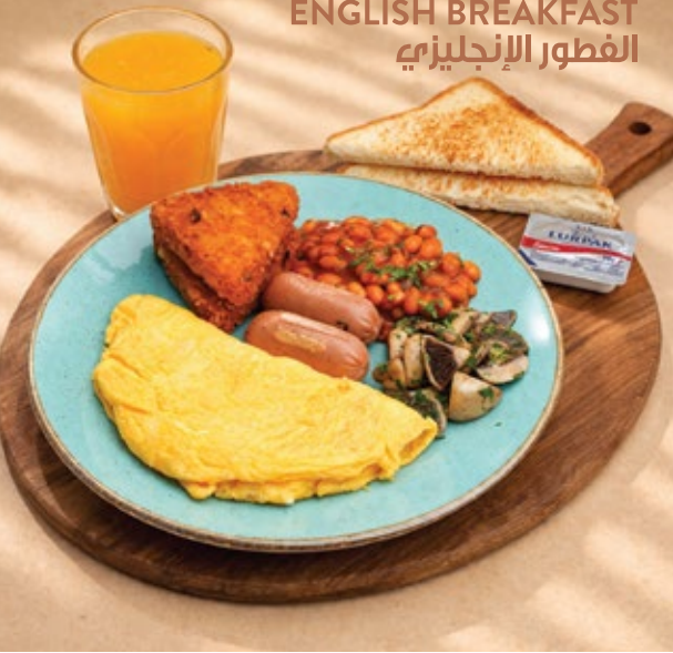
ENGLISH BREAKFAST الفطور الإنجليزي