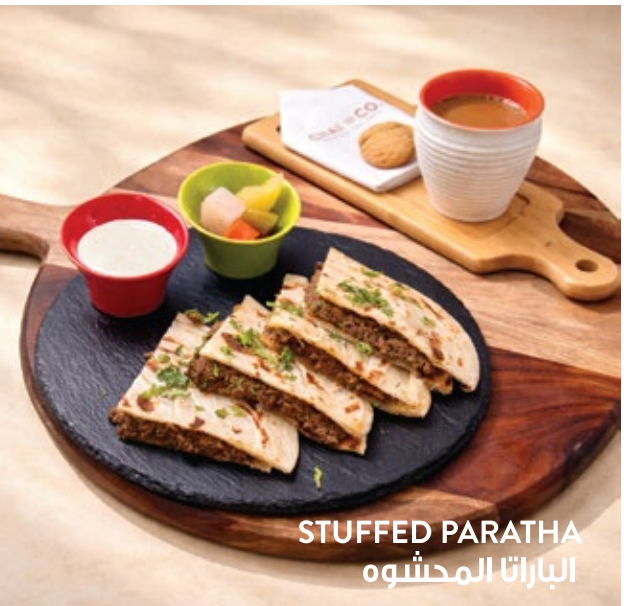
STUFFED PARATHA الباراتا المحشوه